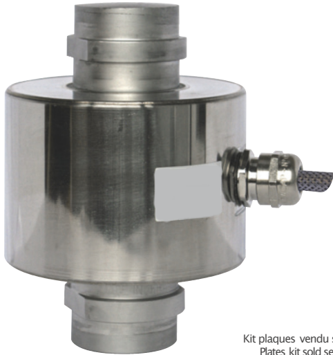
Kit plaques vendu séparément Plates kit sold separately