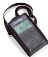
Pochette de transport -Carrying pouch