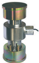
Kit de plaques –Plates kit