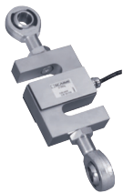
Rotules – Rod end ball joints

MEGATRON, s.r.o. Mrščíkova 16, 10000 Praha 10 T.: 274 780 972, info@megatron.cz www.megatron.cz